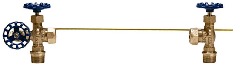
INDICADOR DE NÍVEL PARA LÍQUIDOS – FIG. 081